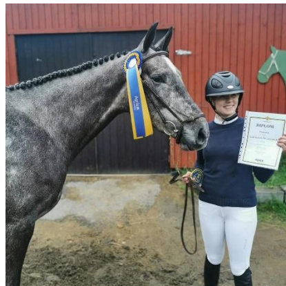
Alexandra Elfströms Good As Gold MV (sto f 2018 e Crusader Ice-Cardento)